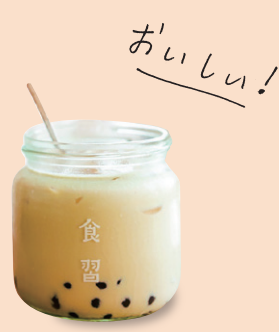
タピオカ ミルクティー(温/冷) 烏龍珍珠奶茶鉄観音 (熱/冷) ¥770