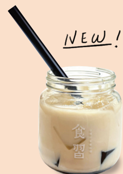
四季春仙草 ミルクティー 四季春仙草奶茶 ¥770