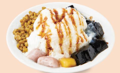
柔らか仙草のスノーアイス 仙草緑豆牛奶冰 仙草ゼリー/緑豆/いももち/黒糖/かき氷 ¥1,100