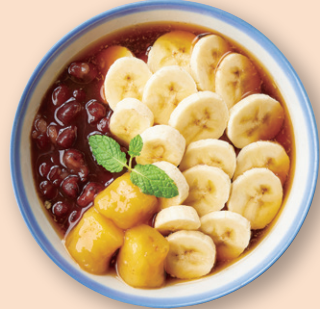
バナナ豆花 香蕉豆花 バナナ/小豆/いももち/豆花 ¥990