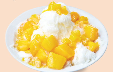
ふわふわかき氷マンゴーミルク 芒果牛奶雪花冰 マンゴー/かき氷 ¥1,210