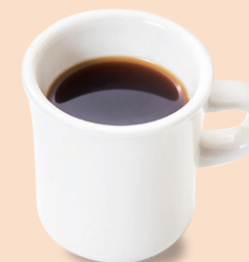
ブレンドコーヒー (温/冷) 咖啡(熱/冷) ¥660 ※フード・スイーツをご注文 いただいた方に限り ¥330