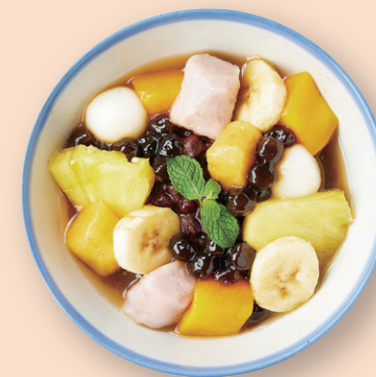
烏龍茶ゼリーのあんみつ 和風烏龍茶凍 鉄観音寒天/パイナップル/マンゴー/ バナナ/あずき/いももち/タピオカ ¥880