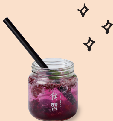
ベリーミント スカッシュ 莓果薄荷蘇打 ¥660