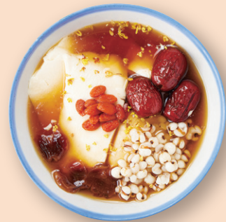
薬膳豆花 薬膳豆花 龍眼/ナツメ/クコの実/ ハトムギ/金木犀/豆花 ¥1,100