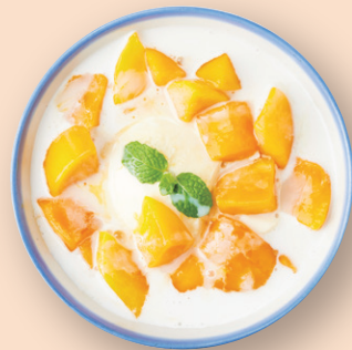
マンゴー豆花 芒果豆花 マンゴー/マンゴーミルク/豆花 ¥1,100