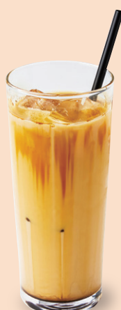
蜜香紅茶 チャイティー(温/冷) 蜜香印度奶茶(熱/冷) ¥770