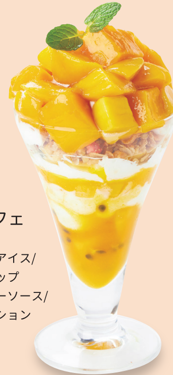
さわやか マンゴーパフェ 酸甜芒果聖代 マンゴー/バニラアイス/ グラノーラ/ホイップ クリーム/マンゴーソース/ ヨーグルト/パッション フルーツソース ¥1,500