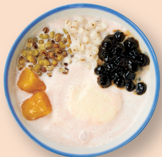
モーモーチャーチャー 豆花 麼麼咋咋豆花 緑豆/ハトムギ/小豆/タピオカ/ いももち/ココナッツミルク/ 豆花 ¥990