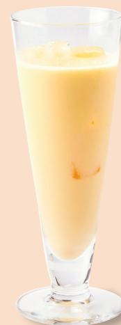
マンゴーミルク スムージー 芒果牛奶奶昔 ¥660