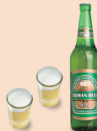
金牌台湾ビール 台灣金牌啤酒 ¥660