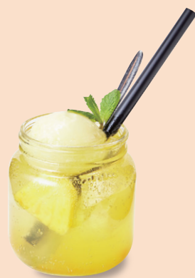
パイナップル ソーダ 鳳梨柚子氣泡飲 ¥770

おすすめ台湾茶(温) 推薦台湾茶(熱) ¥660 ※フード・スイーツをご注文いただいた方に限り ¥550