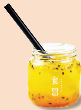
ファンダイ 粉粿フルーツソーダ パッションフルーツ & マンゴー 百香芒果粉粿氣泡飲 ¥770