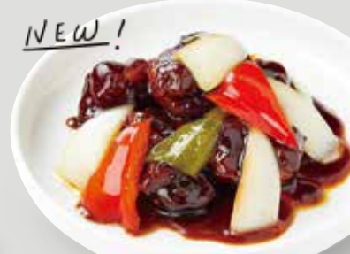
台湾黒酢の酢豚 糖醋小排 ¥1,650

柔らかくて ジューシーな豚肉 を、台湾黒酢で 甘酸っぱくて こってりとした 味に仕上げた 肉料理。