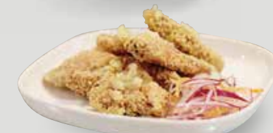
スパイスの香りにサクサクとした衣で からっとあげた、胡椒とニンニクの 風味が絶妙な唐揚げ。