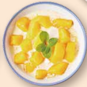
マンゴー豆花 芒果豆花 ¥1,000 マンゴー/マンゴーミルク/豆花