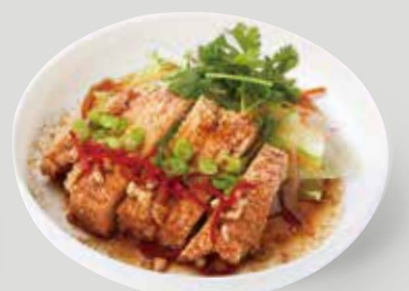
花椒の痺れとソースの 酸味が、揚げ鶏と相性 ピッタリな鶏料理。 揚げ鶏の花椒ソース 秘製酸辣椒麻雞 ¥1,540