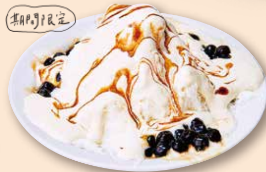
ふんわり鉄観音 クリーム スノーアイス 鐵観音黒糖珍珠雪花冰 ¥1,320 鉄観音ムース/かき氷/ タピオカ/黒糖