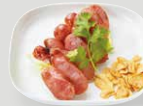
少し甘い味付けで、 ジューシーな旨味が お楽しみいただけます。 台湾ビールにピッタリ! 台湾ソーセージ 台湾香腸 ¥770