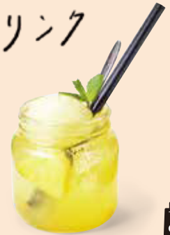
パイナップルスーダ 鳳梨檸檬氣泡飲 ¥660