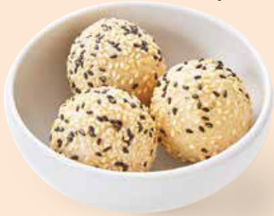
ごま団子 芝麻球 ¥550