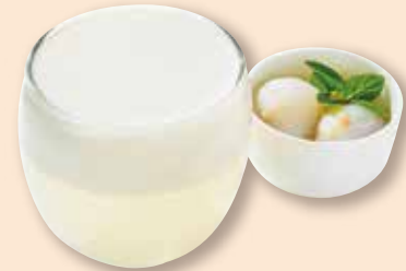
ライチ杏仁ゼリー 荔枝杏仁果凍 ¥660 ライチ/ライチゼリー/ 杏仁豆腐