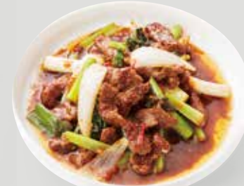
濃厚な沙茶醬と 牛肉の旨味が相性抜群! 牛肉と小松菜の 沙茶醬炒め 沙茶牛肉炒青菜 ¥1,690