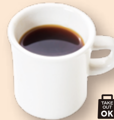
台湾阿里山コーヒー 台湾阿里山咖啡 ¥780