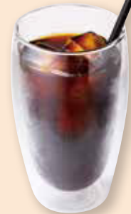
阿里山ブレンド アイスコーヒー 台湾阿里山冰咖啡 ¥780