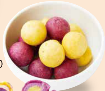
QQボール 台湾地瓜球 ¥770