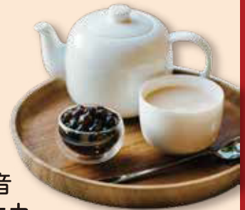
鉄観音 タピオカ ミルクティー(温/冷) 烏龍珍珠奶茶鉄観音 ¥660