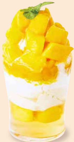
マンゴーパフェ 芒果聖代 ¥1,300 マンゴー/杏仁アイス/豆花/ゼリー/ ヨーグルト/ホイップクリーム