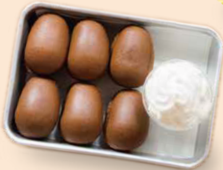
たまごカステラ 老實人雞蛋糕 ¥660