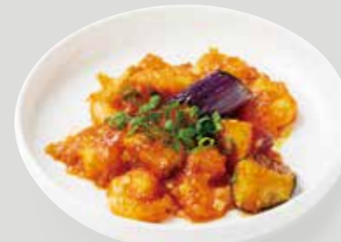
海老のプリッとした食感と、 甘辛いチリソース、たっぷりの 野菜が食欲をそそる一品。 野菜と海老のチリソース 時蔬乾燒蝦仁 ¥1,760