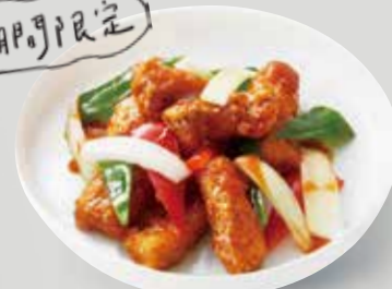
サクッと揚げたハタに烏酢 (台湾黒酢)で作ったあんを絡めた、 さっぱりとした味の魚料理。 ハタの甘酢あん 酥炸糖醋魚片 ¥1,760