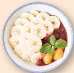
バナナ豆花 香蕉豆花 ¥880 バナナ/小豆/いもち/豆花