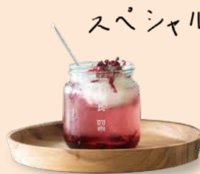
バラローゼルスーダ 玫瑰洛神氣泡 ¥660