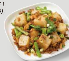
外はサクサクで中は 柔らかく仕上げ、揚げた 卵と合せて。香ばしい 食感がたまりません。 客家式大根餅の炒め 客家乾炒蘿蔔糕 ¥770