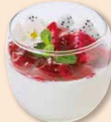
ドラゴンフルーツ 杏仁豆腐 火龍果杏仁豆腐 ¥660 ドラゴンフルーツ/杏仁豆腐/ ドラゴンフルーツソース