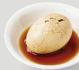
台湾のソウルフード! お茶の香りとほんのり とした甘い後味が やみつきになる 味付け煮卵。 茶たまご 茶葉蛋 ¥165 TAKE OUT OK