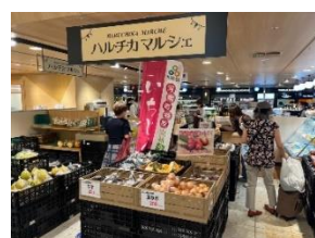
朝採れの新鮮なイチジクを 当日に提供します