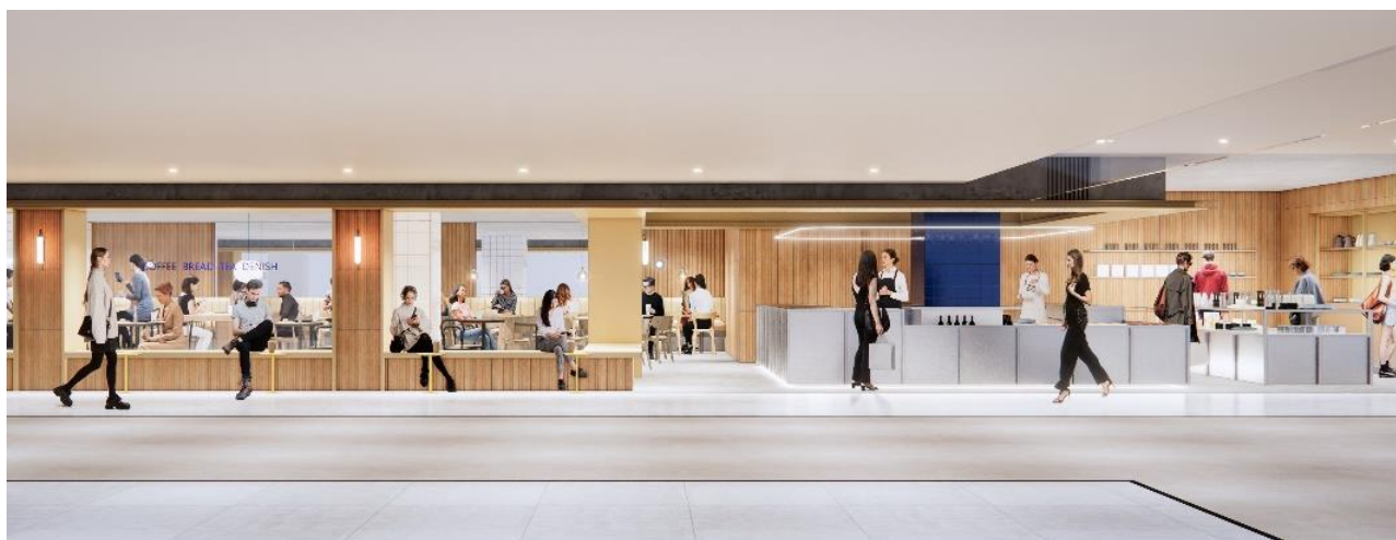
※「KAFFE OTTE(カフェ オッテ)」売場イメージ

暗く長い冬が続く北欧では「あかり」を大切にしています。その「あかり」とともに暮らしを彩ってきた“窓際の風景”をテーマとした空間が広がり、「居心地の良い空間や時間」という意味の“Hygge(ヒュッゲ)”を感じていただける世界観を表現します。