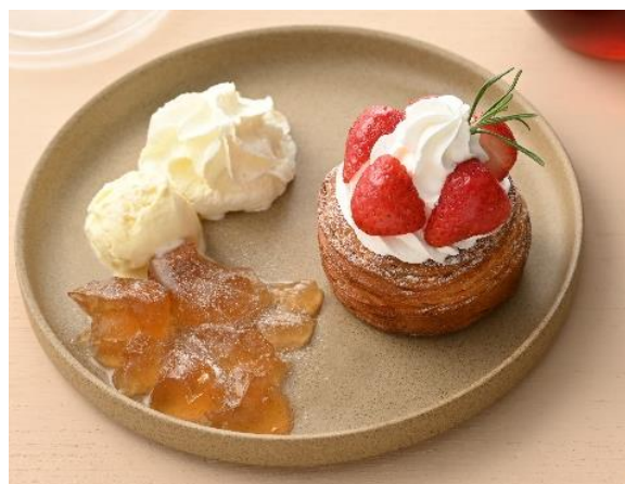
デンマークティータイムセット