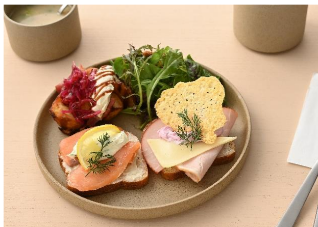
スミアプロプレート

ほかにもデニッシュをメインにしたアフタヌーンティーセットなどもラインナップ。デンマークの老舗紅茶ブランド「A.C.パークス」など、こだわりのドリンクもご用意しています。