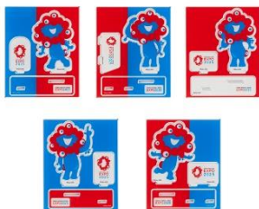
アクリルスタンド ミャクミャク 各種 1,650円