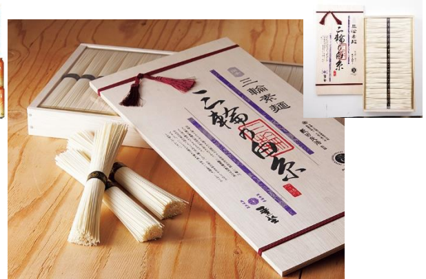
麦坐 三輪素麺 三輪の白糸 3,240円 ★近畿2府5県送料無料