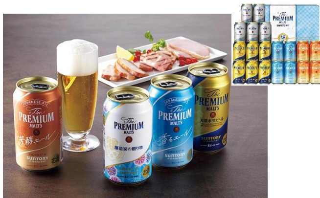
ザ・プレミアム・モルツ「輝」夏の限定4種セット 5,500円 ★近畿2府5県送料無料