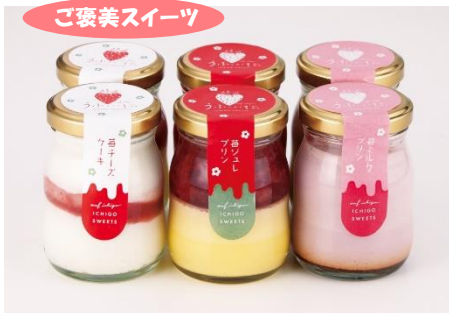
苺づくしボトルスイーツ 詰合せ 3,888円

近年のお中元商戦では、コロナ禍で広まったイエナカ時間を大切にするライフスタイルがアフターコロナの生活でも定着し、「ご自宅用商品」に対するニーズが高まっています。アフターコロナの生活の中でも、贈り物にプラス1品「ご自宅用商品」を選んでいただきたいと思います。本年も自分やご家族に対する“ご褒美スイーツ”や“おうちグルメ”、“理由ありグルメ”を強化しました。