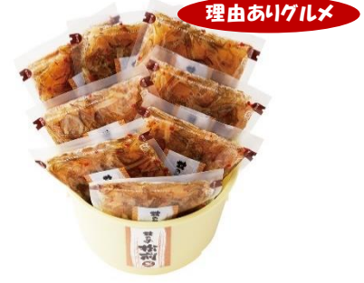
紀久屋 数の子松前 満杯詰合せ 4,860円