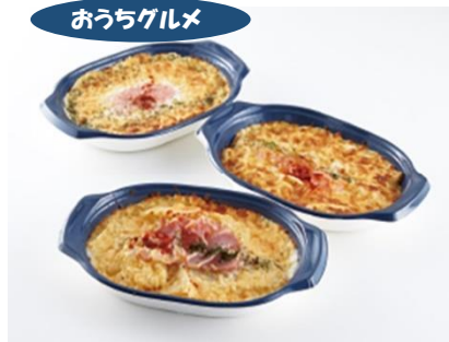
アヴァンセプラス グラタン・ドリア 3種 8個詰合せ 5,184円