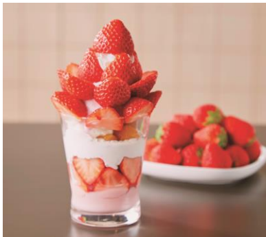
フレッシュイチゴを 贅沢に使用したパフェ