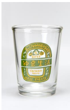
食卓を彩るレトロなデ ザインがキュート