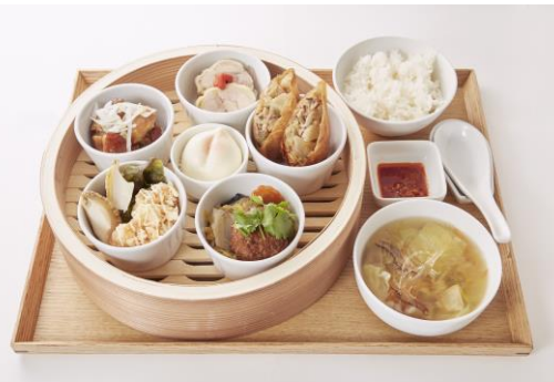
水の流れるように次々と出てくる台湾の 食文化「流水席」を定食にアレンジ