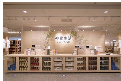
神農生活近鉄あべのハルカス店