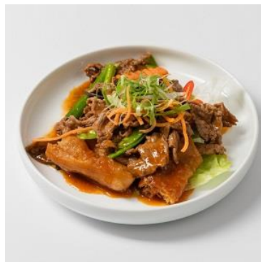
牛肉と揚げパンの炒め