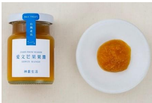
愛文マンゴージャム 100g 1,080 円

低糖度でじっくり120 時間をかけて作り上げられたジャム。マンゴ一本来の甘さを活かした香り豊かな神農オリジナルジャム。