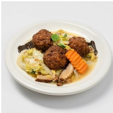
宜蘭(イーラン)西魯肉団子煮込み