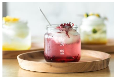
バラローゼルソーダ

神農生活で人気の、たまごを使用したカステラ。ホイップクリームを付けて食べるのがおすすめ。