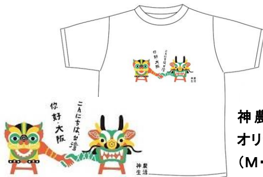
神農×近鉄本店 オリジナルTシャツ (M・L) 1,650 円