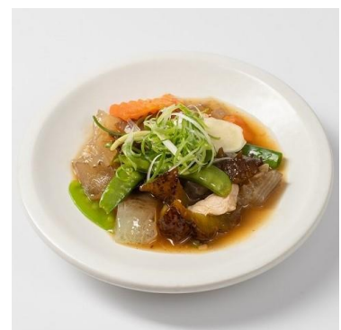
ナマコと魚の浮袋と豚肉の台湾式炒め