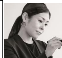
メイクアップアーティスト