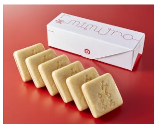
白玉屋榮壽 「みむろ最中」

また、地域商社事業第三弾となる、3種類の新たな奈良の名産品が登場。「大和路ショップ」では、「白玉屋榮壽」「農業生産法人 ポニーの里ファーム」との連携商品の販売を開始します。食以外では、貝ボタン生産量日本一をほこる奈良県川西町「トモイ」と連携、貝ボタンアクセサリーを「東急ハンズ」にて3月26日(火)までの期間限定で販売します。