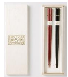
拭き漆のお箸セット