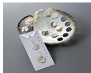
トモイ 「貝ボタンアクセサリー」