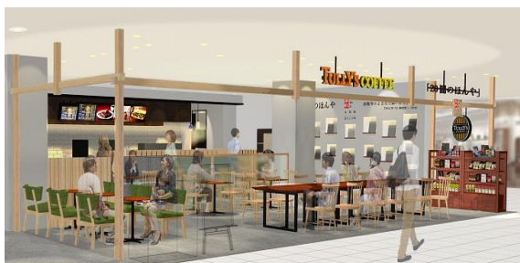
「タリーズコーヒー」(左)、 「大和路 20冊のほんや」(右)

お客様の「 コト消費 」に対するニーズへの対応や店での 滞在時間を伸ばす ことを目的に、当社の従業員が運営を行うFC方式で「タリーズコーヒー」を導入。客席では、隣接する「東急ハンズ」や「大和路 暮らしの間」に関するワークショップを開催するほか、株式会社BACH(パッハ)代表、ブックディレクターの幅 充孝氏が監修した「奈良」をテーマにした書籍を20冊厳選した「大和路 20冊のほんや」を併設し、ブックカフェとして使用するなど多目的に活用します。