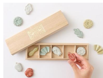
菓子木型の福よせ箸置き