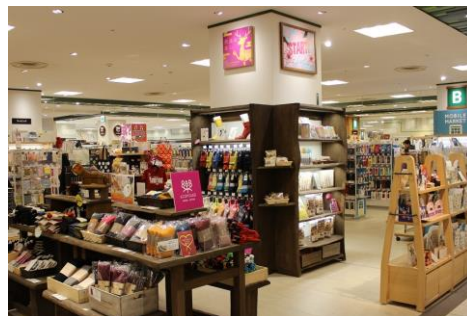
「奈良に良し。」イメージ

季節を楽しめる シーズンスペースの設置 や 人気商品の強化 に加え、 タリーズコーヒーなど5階フロアのショップと連携 し、お客様に 新しい提案 ができるようリニューアル。「奈良の暮らしの良いもの」を厳選したコーナー「奈良に良し。」の商品数も増え、奈良の魅力の発信力も強化します。