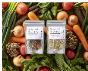
農業生産法人 ポニーの里ファーム 「ドライベジMIX」