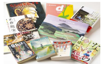
『まひるの月を追いかけて』 恩田陸 『鹿男あをによし』 万城目学 など