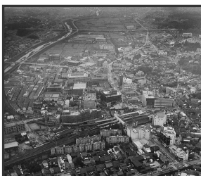
↑昭和49年 枚方市駅周辺の ようす

【期間】平成23年12月1日(木)～平成24年2月29日(水) 【場所】3階京阪連絡口