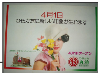
↑昭和50年 当時のポスター