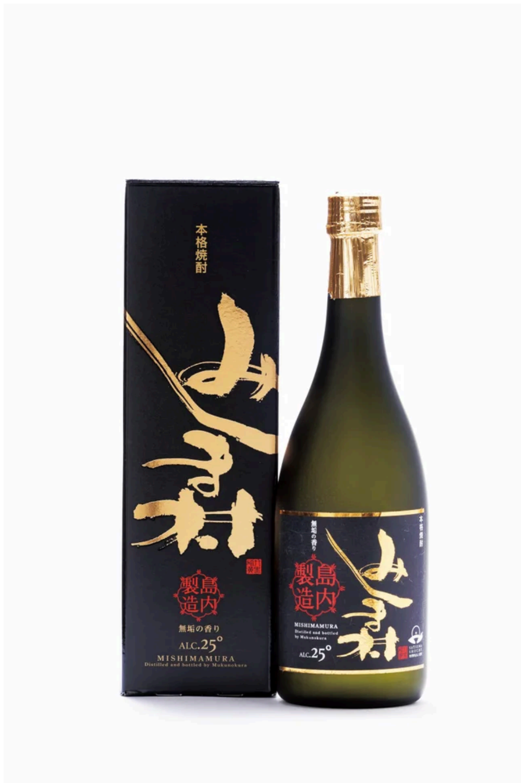
鹿児島郡三島村 みしま焼酎 無垢の蔵 焼酎みしま村 25度 720ml 3,601円