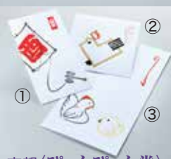
京都〈びよんびよん堂〉 ①ポチ袋(麻西)各種 432円 ②角型ポチ袋(干支西)各種 540円 ③ご祝儀袋(親子西)各種 648円 木版手刷りと紙使用