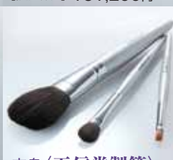
広島〈玉信堂製筆〉 化粧筆3本セット チークブラシ、アイシャドー ブラシ、リップブラシ 【限定数10】 8,100円