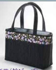
千葉〈柏ビーズ〉 グラスビーズハンドバッグ グラスビーズ・牛革、約横19×高さ26.5×まち11cm 【現品限り】 216,000円