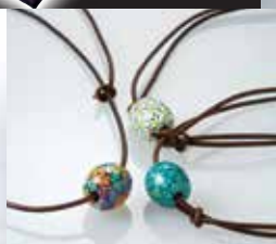
大阪〈藤村トンボ玉工房〉 トンボ玉 花玉 クリスタルガラス 【限定数10】 各21,600円