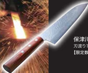
保津川三徳 刃渡り18cm、特殊鋼使用 【限定数10】 10,260円