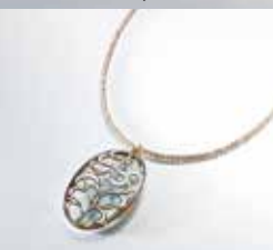
京都〈中嶋象嵌〉 ヒスイ両面唐草透かしペンダント 国産翡翠・象嵌(鉄・金・銀・漆)、K18 4×2.5cm 【限定数2】129,600円