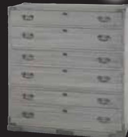
福島〈曾津杢本〉 二段引出し三重ね(金具付) 桐材、幅100×奥行45×高さ115cm 【限定数5】 432,000円