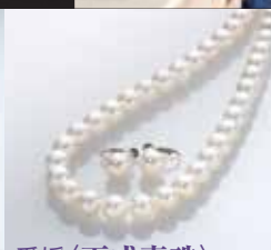
愛媛〈天成真珠〉 アコヤ真珠ネックレス・イヤリングセット ネックレス:8~8.5mm珠、42cm、イヤリング:8.5mm珠 (鑑別書付)、SVクラス、K14WGイヤリング枠 【限定数2】 151,200円