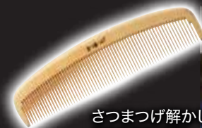
さつまつげ解かし櫛 鹿児島県産つげ材、 約16.5cm(5寸5分) 【限定数20】 27,000円