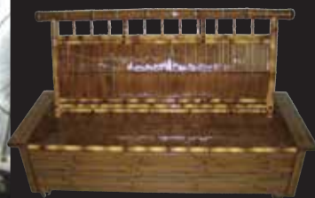
宮崎〈梅里竹芸〉 健康長いす 竹・杉、 幅162×奥行70×高さ96(座面高42)cm 410,400円