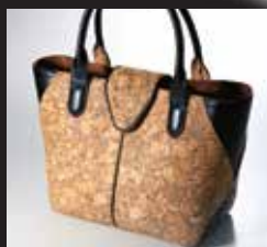
福島〈コルクハウスなずな〉 大型コルクトートバッグ コルク樹皮 【限定数5】 54,000円