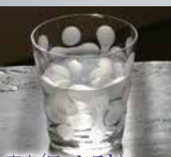
東京〈フォレスト〉 蒲田モダンウォーター グラス ソーダグラス、 口径7.8×高さ9cm 8,100円