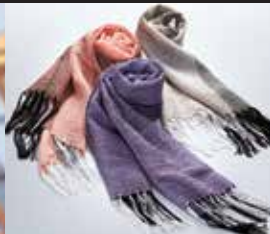
京都〈HANAゆうき〉 からみ織 モールマフラー各種 絹100%、45×180cm(房別)、3色 【各色限定数2】 各19,980円