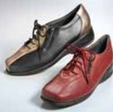
東京〈浅草コレクション〉 婦人ウォーキングシューズ各種 4E、22.0~25.0cm 【限定数20】 各5,940円