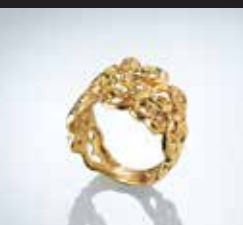
東京〈創作ジュエリーミカミ〉 K18ダイヤモンドリング 幅1.4cm 【現品限り】 151,200円