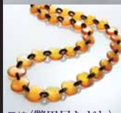
長崎〈鼈甲屋たがわ〉 べっ甲ネックレス 60cm 【現品限り】 194,400円