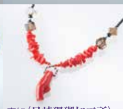
高知〈貝崎珊瑚加工所〉 珊瑚ネックレス 約41cm、 スピネル赤枝トップ付・茶水晶 【限定数3】 86,400円