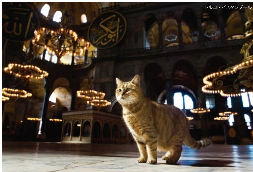
トルコ・イスタンブール