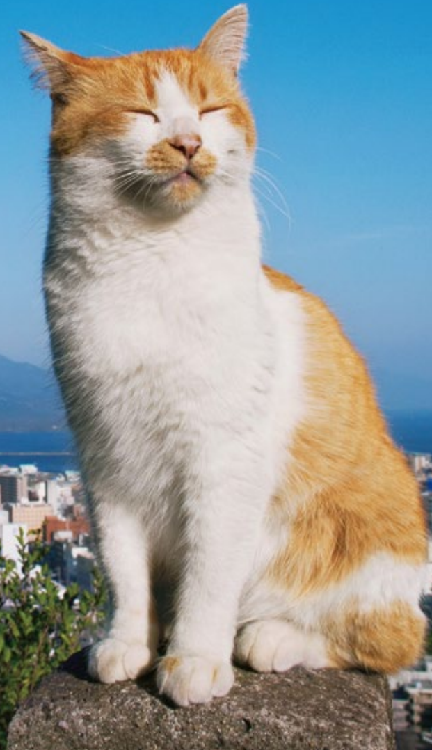
鹿児島県鹿児島市