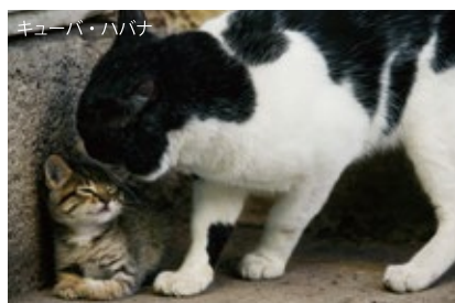
キューバ・ハバナ