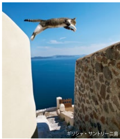
ギリシャ・サントリーニ島