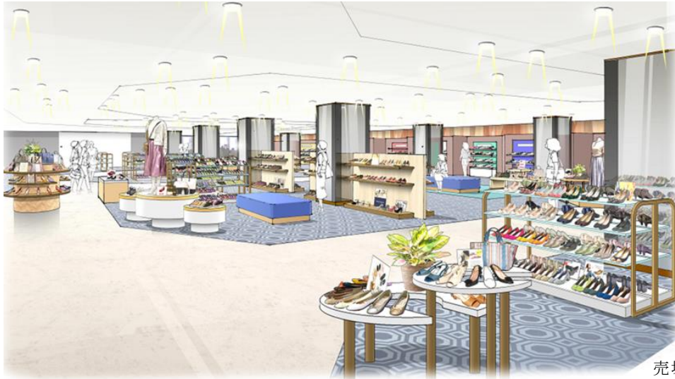
売場イメージパース