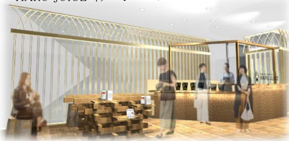
HARU JUICE イメージパース