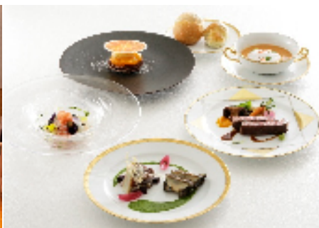
ディナー（イメージ）