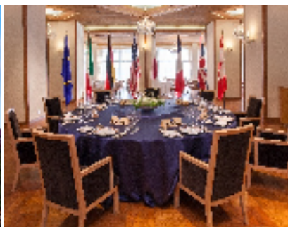
ディナー会場（イメージ）