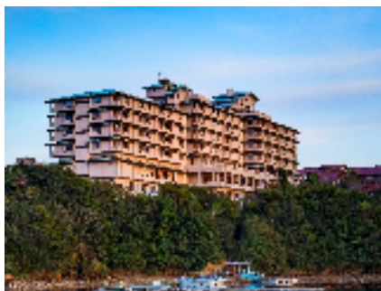
志摩観光ホテル ザ クラシック外観