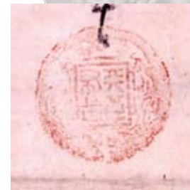
龍に囲まれた「天下布武」の朱印