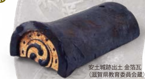
安土城跡出土 金箔瓦 (滋賀県教育委員会蔵)